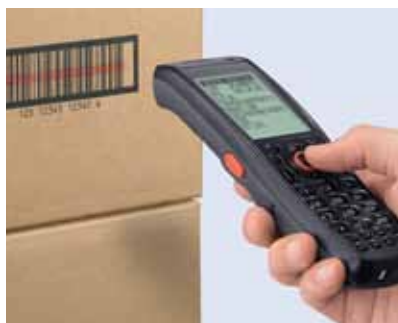
Устройство для горизонтального сканирования

Выпускаются две модели, которые отличаются углами сканирования. В результате можно выбрать идеальное устройство для намеченного спектра приложений. Кроме того, сканер имеет настраиваемую ширину лазерного луча, что обеспечивает быстрое и с минимальной степенью погрешности сканирование даже при считывании близкорасположенных штрих-кодов.