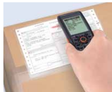
Устройство для сканирования под углом